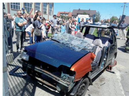
Inscenizacja wypadku drogowego.