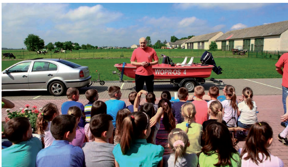
Dzień Dziecka w ZS w Ołdakach.