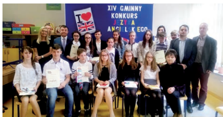
Uczestnicy konkursu j. angielskiego wraz z opiekunami.