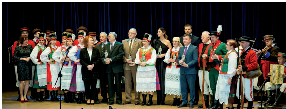
Laureaci Kurpika 2015 r.