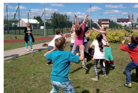
Integrujące zabawy w stylu retro w SP w Rzekuniu.