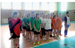
Drużyny przystępujące do zawodów.