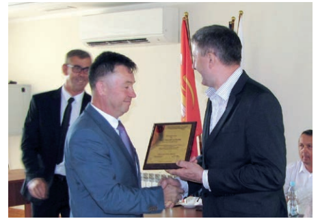
Podziękowania dla Stanisława Kubla Starosty Ostrołęckiego.