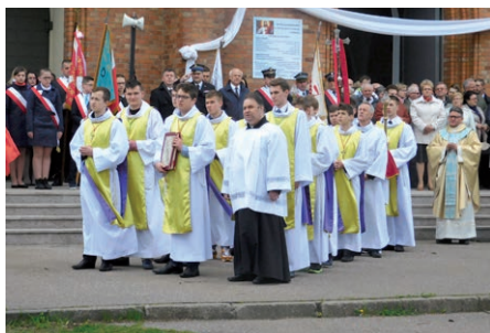
Rozpoczęcie uroczystości 3 Maja odśpiewaniem Hymnu Polski.