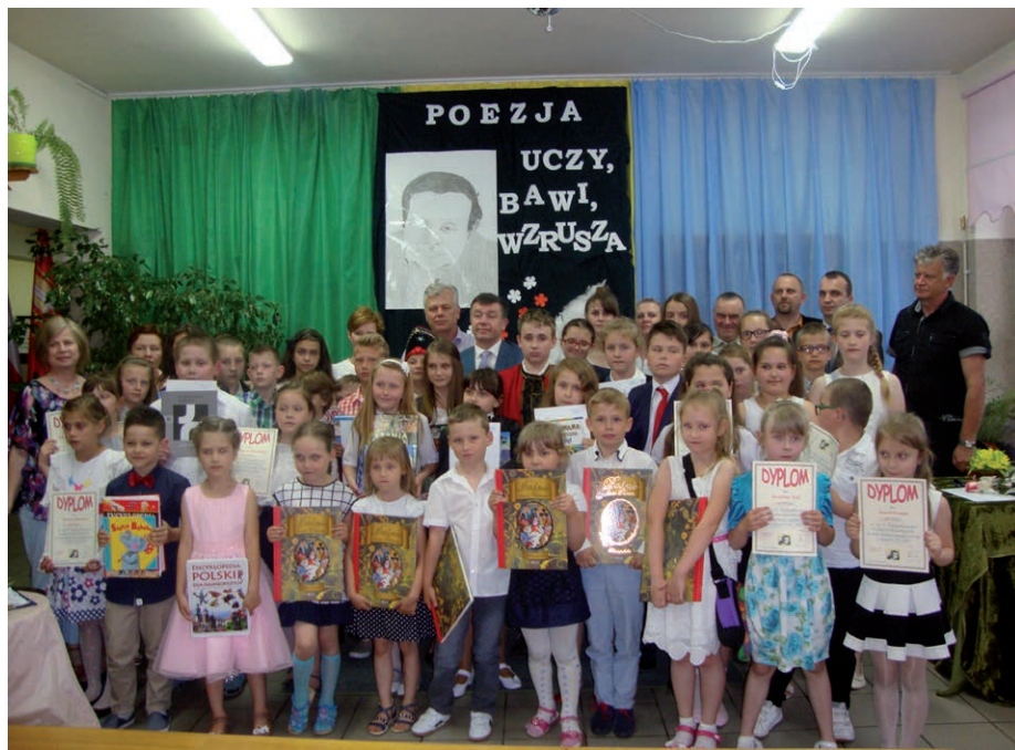
Uczestnicy XVIII konkursu recytatorskiego w Dzbeninie