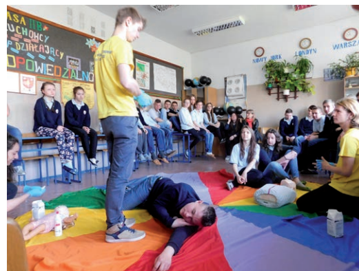
Warsztaty udzielania pomocy przedmedycznej.