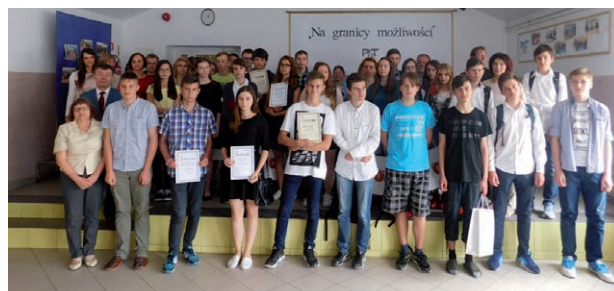
Uczestnicy konkursu Cogito Ergo Sum.

Opracowali: Wioletta Napiórkowska Sylwester Wocial