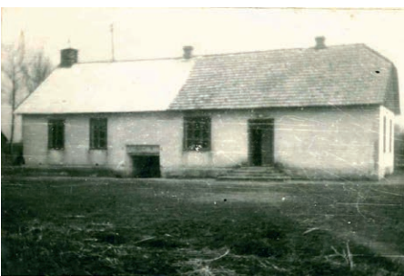
Widok szkoły od strony podwórka.