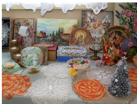
Efekty pracy gospodyń.