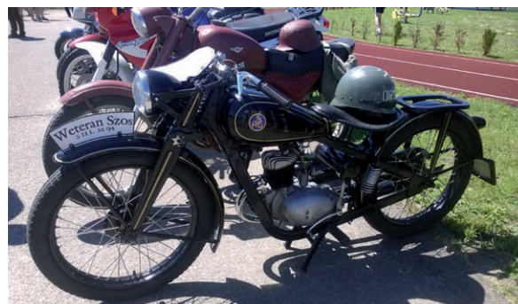
Stare pojazdy dwukołowe.